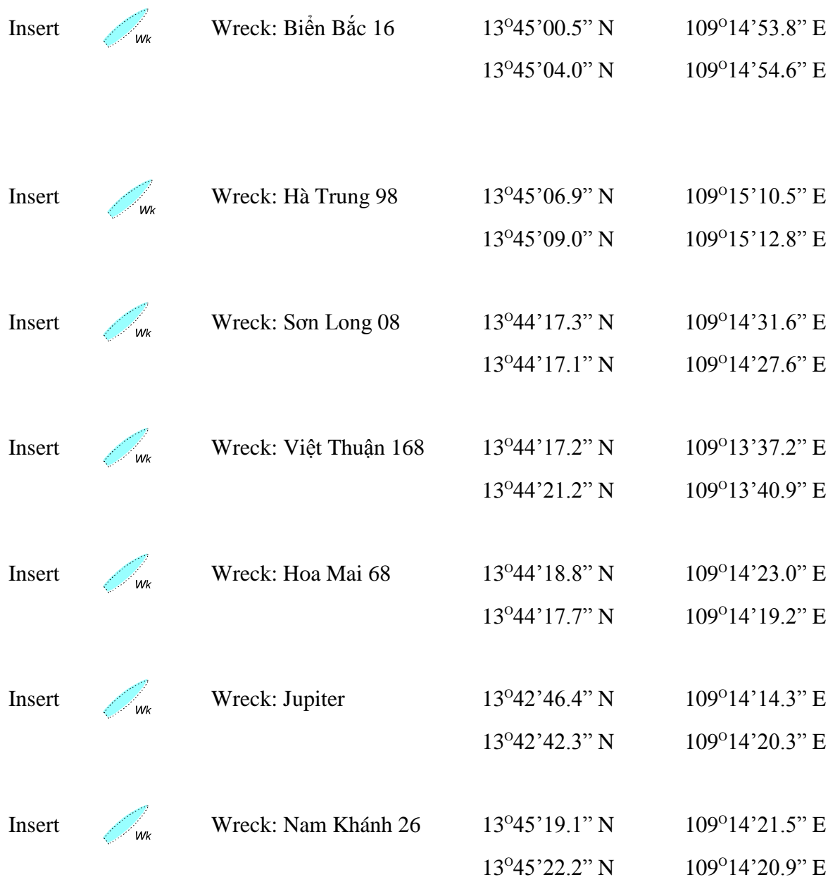
Chart affected –VN4QN001 (Edition No. 1, Edition date November 08 th , 2017)

(All positions are affected to WGS 84 Datum)